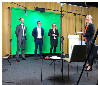
Bild från studion under Lindholmen Software Development Day 2020.

o Vi har även, i början av 2020, varit engagerade i nätverket Digital Skills and Jobs Coalition Sweden. Detta nätverk har dock, av olika anledningar, tagit en paus under pandemin. Från Swedsofts sida hoppas vi dock på att nätverket ska komma igång igen snart.