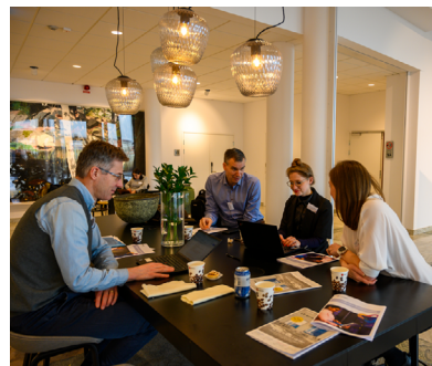
Gruppdiskussion under Samling av mjukvarusverige

o Samling av mjukvarusverige är workshopen dit vi bjuder in en beslutsfattare per organisation från alla medlemmar samt andra viktiga myndigheter, organisationer, lärosäten och företag. Här arbetar vi varje år kring en aktuell fråga, vilken 2020 var att ge input till regeringsuppdraget om digital spetskompetens . Under dagen skapas även utrymme för att knyta nya kontakter och samarbeten. Samling av mjukvarusverige blev en av två fysiska träffar Swedsoft arrangerade under 2020 och genomfördes i början av februari. Från denna dag tog vi bland annat fram rapporten "Hur kan Sverige bli världsledande på digital spetskompetens?" .